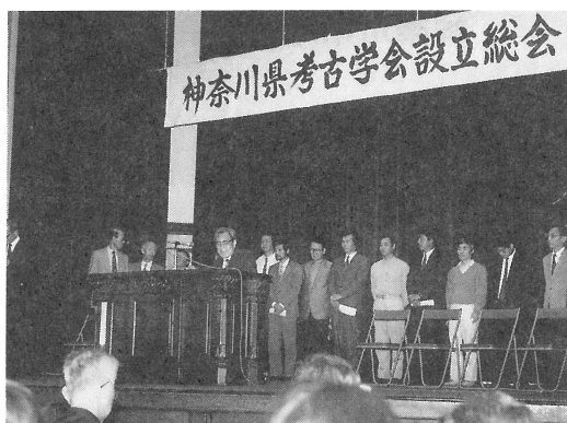
設 立 総 会