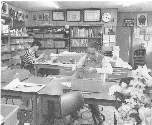
研究所内での整理

主な展示資料としては、川崎市内でも発見例の少ない旧石器時代の遺跡である黒川東遺跡出土の石器類をはじめ、市内の重要な遺跡から出土した土器・鉄器類などがあります。また、約4000冊にも及ぶ蔵書も納められており、希望者は閲覧することができます。