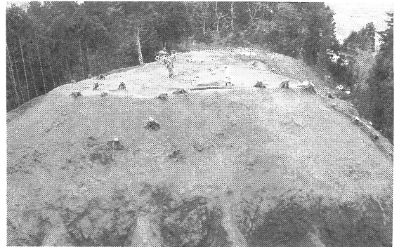
▲ 発掘中の河村城跡

12月6日(土)午後1時、山北駅前集合、参加者22名。冬という気候がうそのようなぼかぼか陽気の日であり、ハイキング日和の1日であった。駅より15分足らずで、城址入口に着く。急坂をあえぎあえぎ登り、茶臼郭の所にて畝堀の跡をのぞき込む。後北条氏の時代に作られたようだが、郭と郭の間を掘込んで敵が攻めにくいようになっており、初めて見る畝堀の跡に工事の大変さを実感する。本城郭から蔵郭、近藤郭、大庭郭と廻ったが、非常に保存状態が良く、本格的な発掘と整備が待たれるところである。貴重な山城跡を見学できて、大変勉強になった。今回の見学会は天気も良く、和やかな雰囲気の中で1日のんびりと歩いたが、女性の方は1名のみの参加で、次回より多数の女性会員の参加を期待するものである。幹事の方に感謝…………。